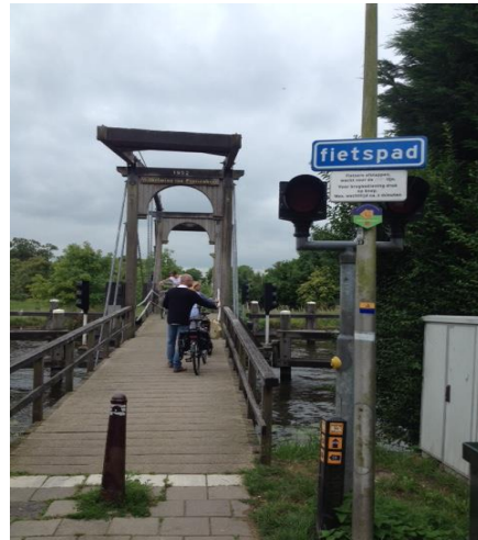
Fietsbrug Wilhelmina van Pruisen in Hekendorp

Het puin en grofvuil gaat in een container per vrachtwagen naar een erkende verwerker. De bagger wordt overgeladen in grotere beunbakken of schepen.