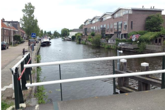
Baggeren dichtbij huizen en bedrijven, zoals in Haastrecht

Het gaat om het onderhouden en deels verdiepen van de rivier. We hebben er daarbij rekening mee te houden dat de Gekanaliseerde Hollandsche IJssel dwars door historische stadjes stroomt en dicht langs huizen en bedrijven.