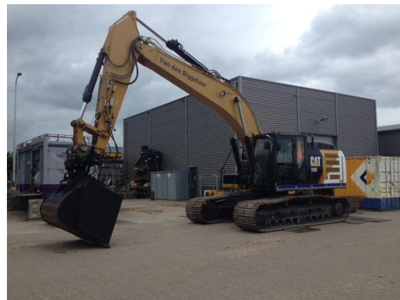
Hydraulische graafmachine met vizierbak

Door het werkgebied te verdelen, enerzijds tussen Gouda en Montfoort en anderzijds tussen Montfoort en Nieuwegein, verminderen we het aantal vaarbewegingen voor schippers en voor bewoners langs het water met de helft.