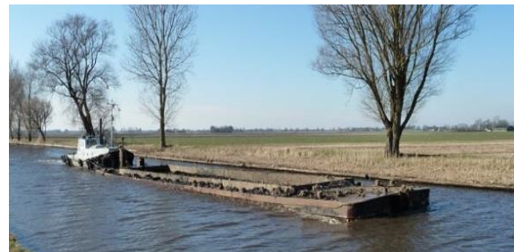
Duwboot met lage beunbak

We gaan zeer zorgvuldig om met zowel de omgeving, als de verontreinigingen en de oevers en kaden. Zo werken we vanaf het water, zodat we de oevers en kaden niet extra belasten.